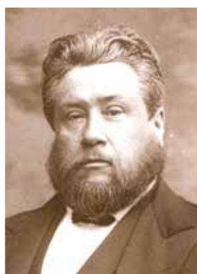
Чарльз Хаддон Сперджен (1834—1892)

Во второй половине XIX века широко известным баптистским проповедником был Чарльз Хаддон Сперджен (1834—1892) — человек, яркий проповеднический дар и литературные способности которого оставили нам ценное наследие проповедей и комментариев. В возрасте 19 лет он был