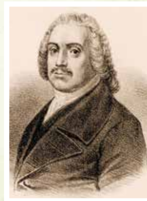
Роджер Уильямс (1603—1683)

В феврале 1631 года на американский континент прибыл пуританин Роджер Уильямс. Он стал резко выступать против попрания свободы вероисповедания, говорил о необходимости разделить светскую и церковную власть. Уильямса преследовали, он бежал, сначала укрылся у индейцев, а потом основал поселение Провиденс. Вскоре здесь появилась колония Род-Айленд, где была официально